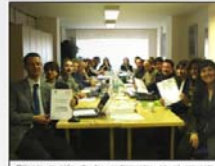
Primera reunión de los participantes en el proyecto celebrada en Florencia los días 6 y 7 de marzo de 2012.