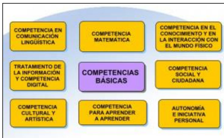
Fig. 1: Esquema de competencias básicas ( http://competenciasbasicas.webnode.es/ )

La competencia que más se desarrolla en el aprendizaje de la química es la competencia en el conocimiento y la interacción con el mundo físico. Esta competencia se define en el anexo I del decreto de enseñanzas mínimas de la ESO (RD 1631/2006) como: